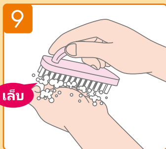
ใช้แปรงขัดเล็บถูเบา ๆ บริเวณใต้เล็บของคุณ