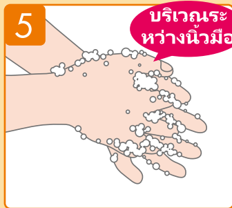
ถูระหว่างนิ้วมือทั้งสองข้างของคุณ