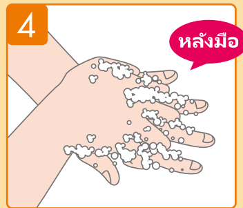
ถูหลังมือด้วยฝ่ามืออีกข้างหนึ่งของคุณ ทำขั้นตอนเดียวกันนี้กับมืออีกข้างหนึ่ง