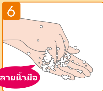
ถูฝ่ามือของคุณด้วยปลายนิ้วมืออีกข้างหนึ่ง ทำขั้นตอนเดียวกันนี้กับมืออีกข้างหนึ่ง