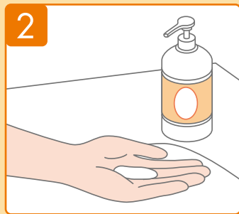
ใช้สบู่เหลวในปริมาณที่เหมาะสม