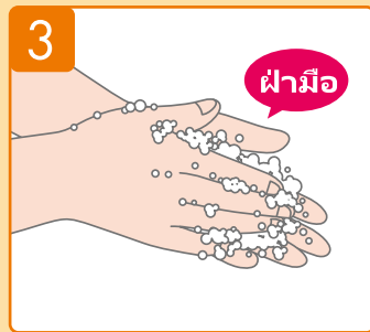
ถูมือเพื่อให้เกิดฟอง