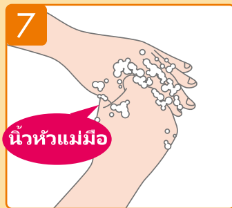
ใช้มือข้างหนึ่งโอบรอบนิ้วหัวแม่มือของมืออีกข้างหนึ่ง ทำขั้นตอนเดียวกันนี้กับมืออีกข้างหนึ่ง