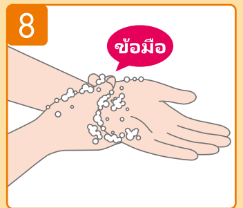
ถูเบา ๆ บริเวณรอบข้อมือทั้งสองข้าง