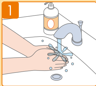
ล้างมือของคุณด้วยน้ำประปา