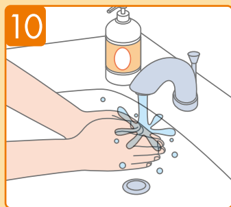
ล้างมือให้สะอาดอย่างทั่วถึงด้วยน้ำประปา