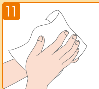
เช็ดมือให้แห้งด้วยกระดาษทิชชู (เครื่องเป่ามือ)