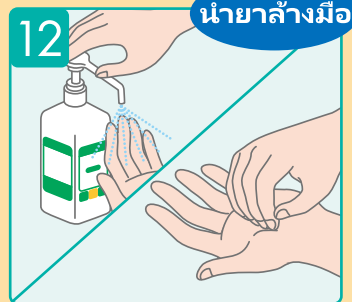
ถุนํ้ายาล้างมือให้ทั่วมือของคุณ อย่าลืมถุนํ้ายาหรือเจลล้างมือระหว่างนิ้วมือ นิ้วหัวแม่มือ และข้อมือ